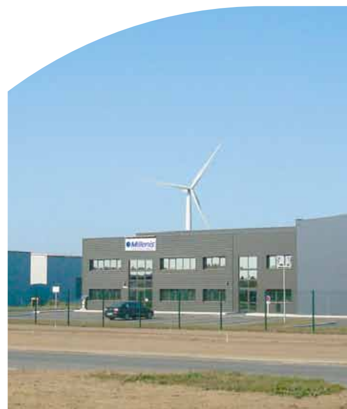
Dry product storage, Plestan, France